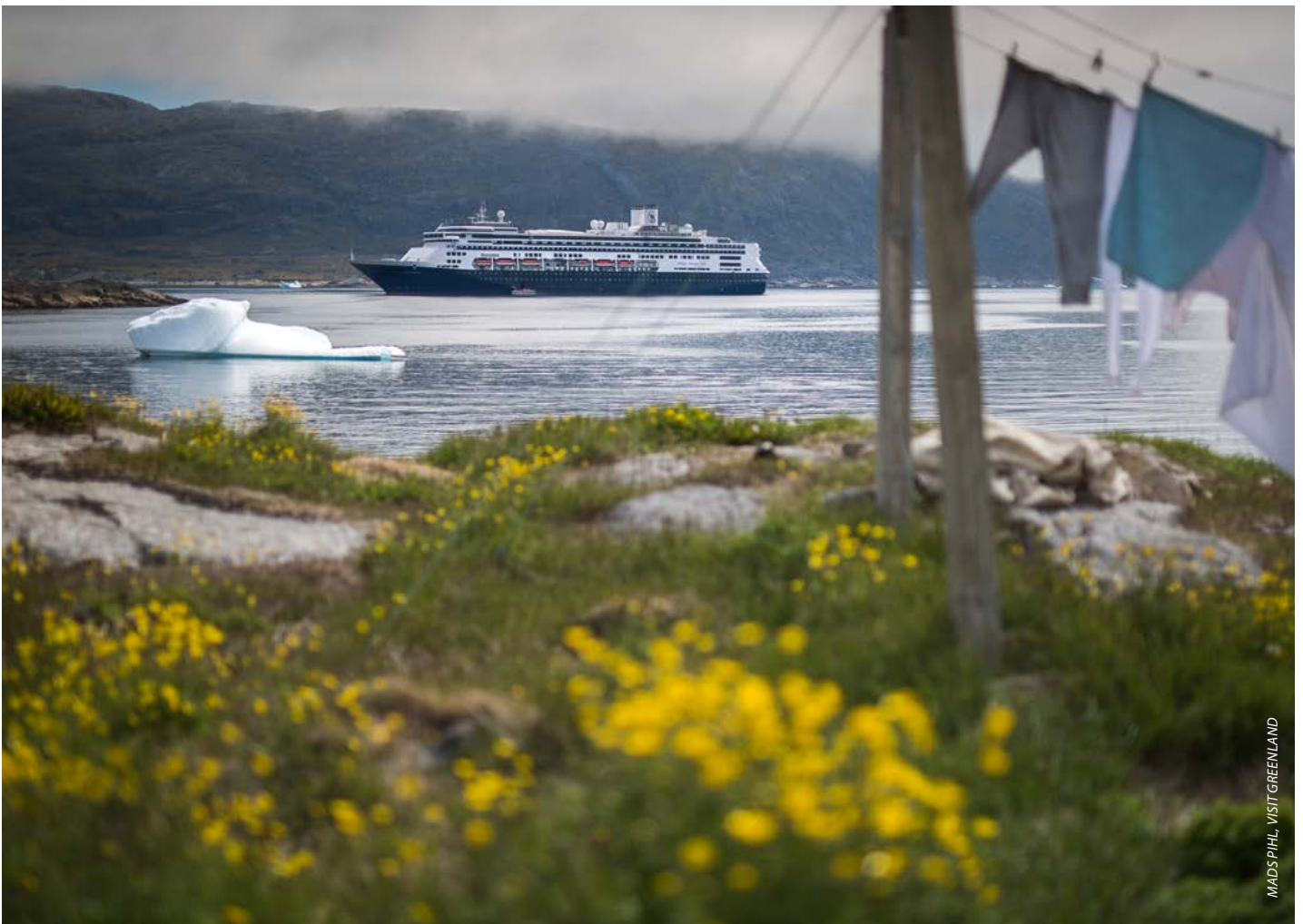
MADS PIHL, VISIT GREENLAND

out that we, as destinations and businesses, can make more money. We can get better at planning guests' stays and transporting them around town, so they have plenty of opportunities to visit the shops. In addition, it makes a big difference if you, as a store, accommodate the language barriers of your customers. If they understand the products, prices, and background, they also understand the value of the product. This is especially true in specialty stores with higher prices.